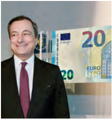
Mario Draghi Président, Banque centrale européenne

Depuis leur introduction en 2002, les billets en euros sont devenus l'un des moyens de paiement les plus fiables dans le monde et ils sont un symbole puissant de l'intégration européenne. Aujourd'hui, ils sont la monnaie de dix-neuf pays et de 338 millions d'Européens ; il est de notre devoir de préserver cette confiance en rendant notre monnaie encore plus sûre en y intégrant la technologie la plus récente dans le domaine de la conception des billets.